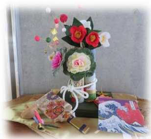
美里中アートギャラリーより